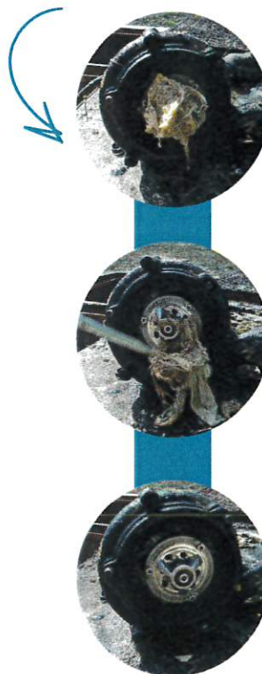
Roue de pompe bouchée par des lingettes avant, pendant et après intervention